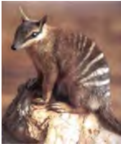
La Mirmekobo (Vidu paĝon 32)

http://web.me.com/donbroadribb1/donbroadribb1_Mirmekobo/