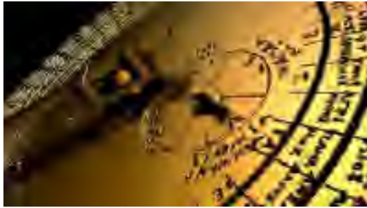
Parto de la teksto sur malantaŭa rado de la maŝino