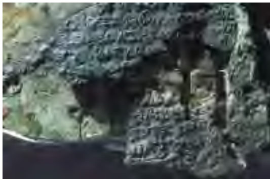
Kelkaj aliaj partoj de la maŝino