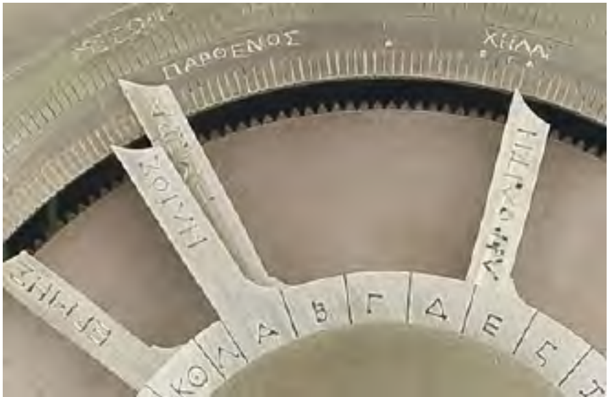
Pligrandigita foto de la antaŭaciferplato, rekonstruita de Michael Wright