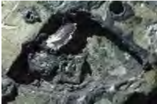
Kaj ankoraŭ alia foto