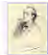
Sherlock Holmes (desegnita de Sidney Paget, 1904)

“Jes, sed ... Ĉu vi diras ke iel Mycroft, je sia morto, sendis telegramon?