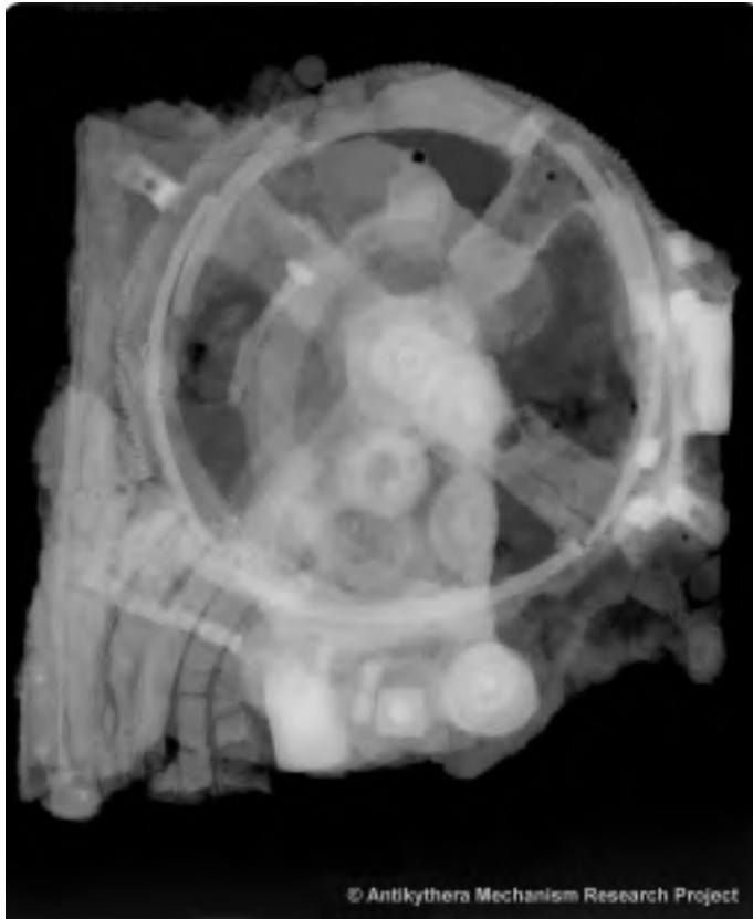
Tridimensia rentgena bildo de la ero, farita per mikrofokusa rentgenilo X-Tek 225kV en 2003k.e. 2

(eklipsoj) kaj la moviĝo de la aliaj steloj kaj planedoj konataj tiuepoke. La mekanismo estis verŝajne konstruita de inĝenia mekanikisto el la skolo de Posidonio 1 en Rodiso.