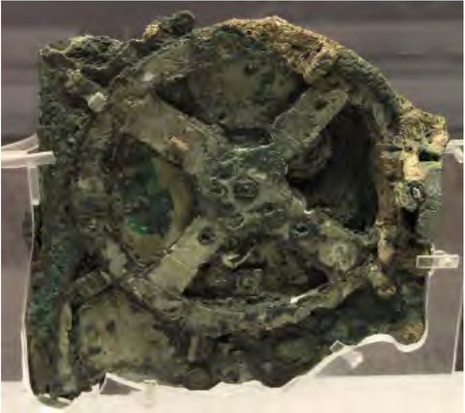
La rustiĝinta, plej granda ero de la trovita mekanismo

En la jaro 1900 oni trovis sur la oceana profundo proksime al la insulo Antiktero en ŝipovrako tre rustan aparaton misteran.