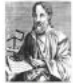
Episkopo Eusebius Pamphili 263-339k.e.

Laktantio 1 “De mortibus persecutorum” el la 14-a jarcento. Ankaŭ troviĝas publikigitaj sciigoj en “Historio de Kristanismo” de Episkopo Eusebio 2 , kiu notadis la historion de frua kristanismo dum la Romia imperio.