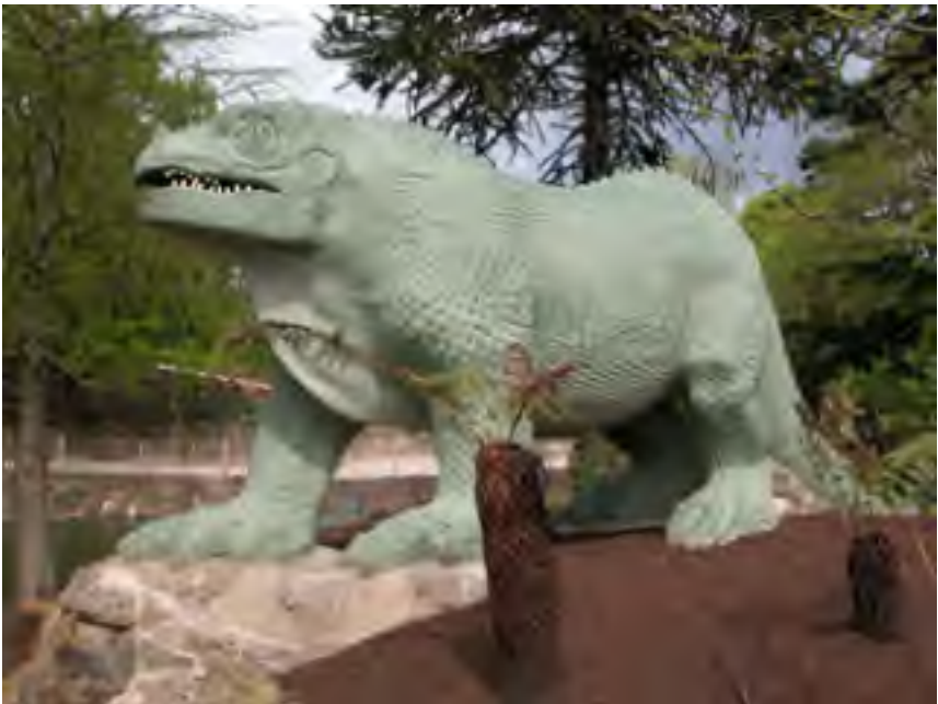
“Igvanoĉonto” skulptita de Benjamin Waterhouse Hawkins in 1854 (Hawkins nur imagis la formon de Igvanoĉonto.) Plu staras, en Londono.