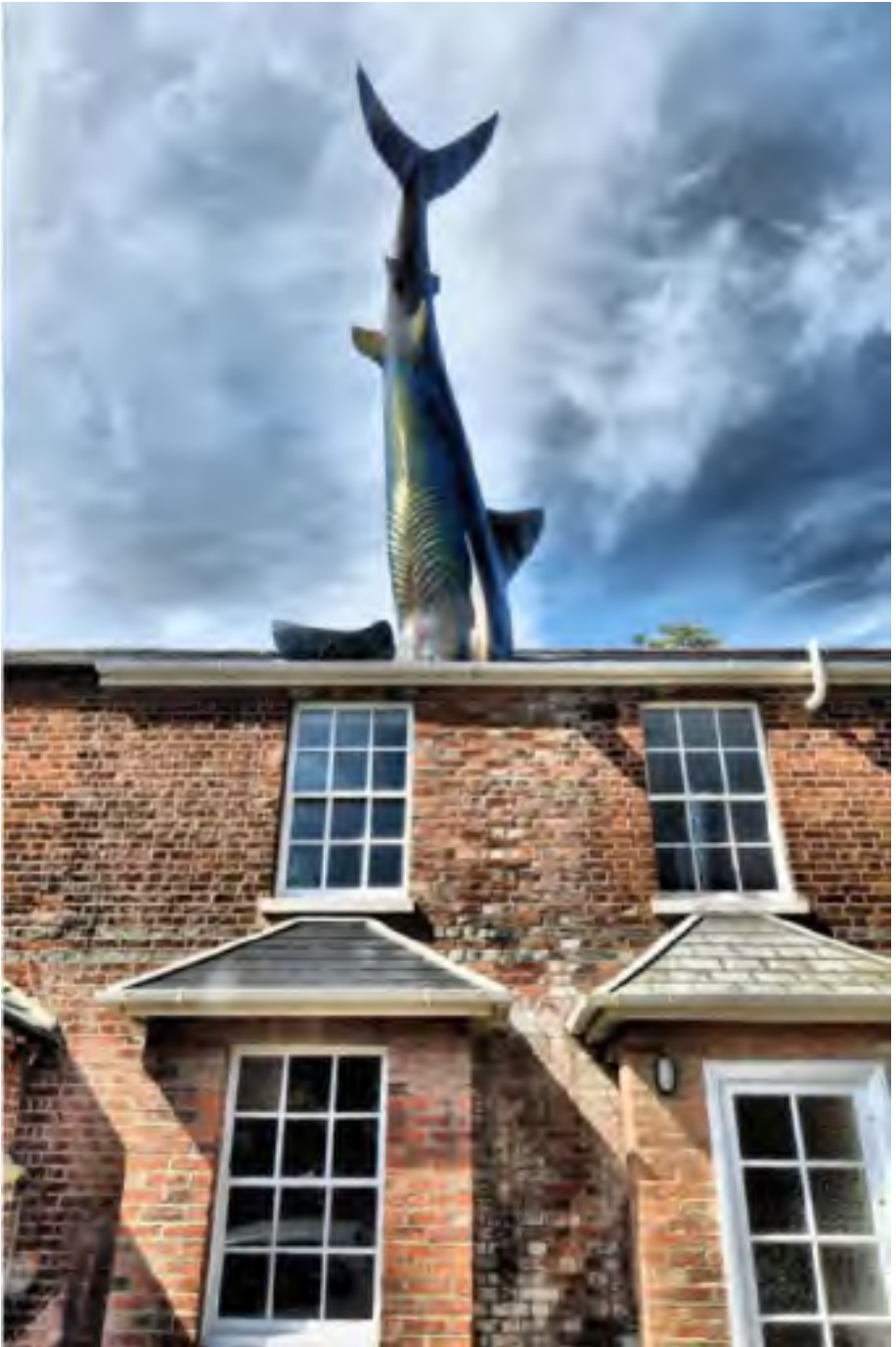
“Sarko”, 1986, en Headington Oxford