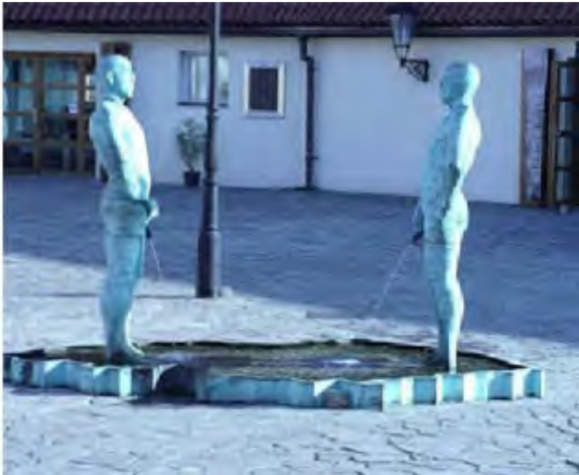
“Pisantoj” (Prago). Skulptis David Cerny, 2004. 210cm alta