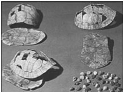
Testudoŝeloj el Ĉinio, ĉ.6500AKE

Malfacilas distingi inter simpla skiza bildo, en la praantikva epoko, kaj frua ekzemplo de skribo. Pro tio, ĉu aŭ ne la ĉisekva bildo el Ĉinio indikas skribaĵon, estas pridisputate: 1