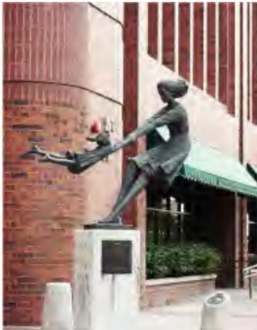
En Salt Lake City, Utah (Usono)