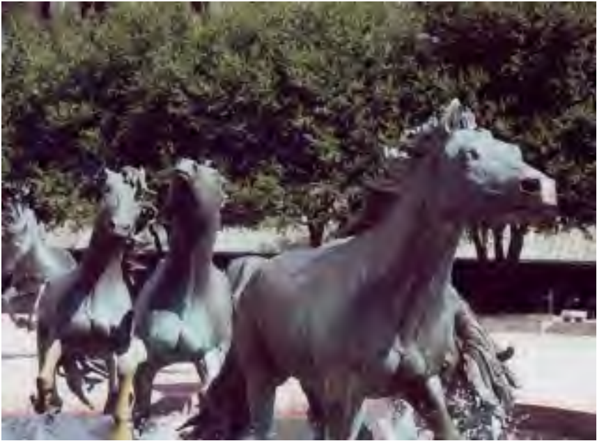
“Mustangoj ĉe Las Colinas”, skulptaĵo el bronzo, de Robert Glen, en Irving, Texas (Usono)