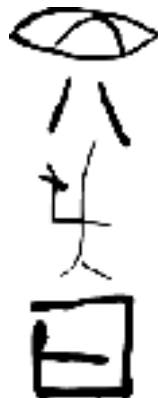
Kelkaj fruaj bildoj

Multaj ekspertoj diras ke la figuroj en la ŝeloj similegas al ĉinaj ideografiaĵoj uzataj plurmil jarojn poste (ĉ. 1500AKE). Tamen, pro la manko de trovo de tiaj ideografiaĵoj el la interaj jarcentoj, aliaj ekspertoj opinias ke temas nur pri hazardaj figuroj sensignifaj.