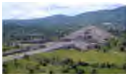
La Piramido de la Luno en Teotihuacín, Meksiko