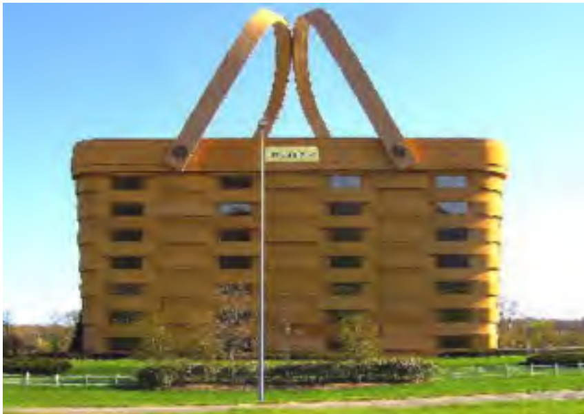
Oficejoj de la Korbofabrikista Kompanio Longaberger, en Newark, Ohio (Usono)