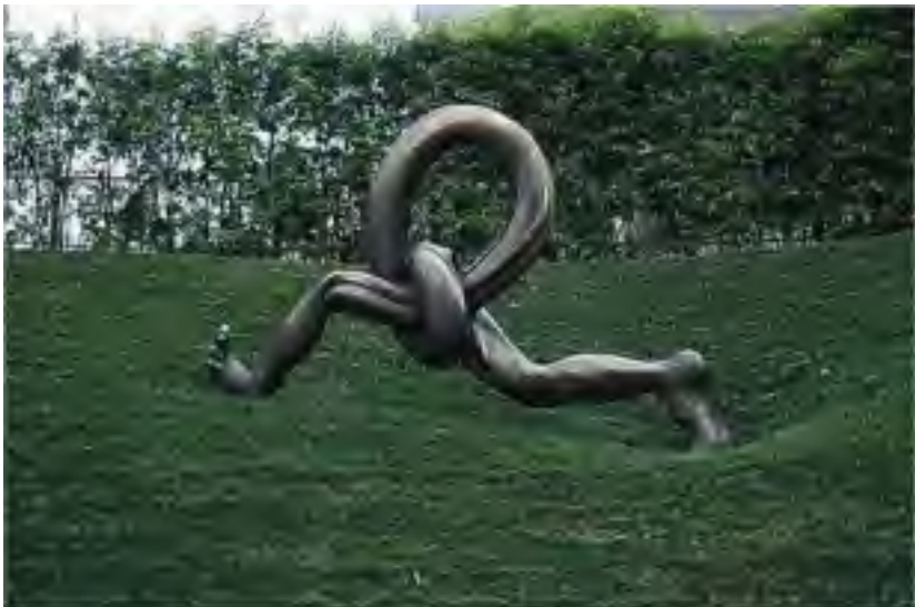
“Kurantaj Kruroj” en Kanazawa (Japanio). Skulptis Ku BomJu