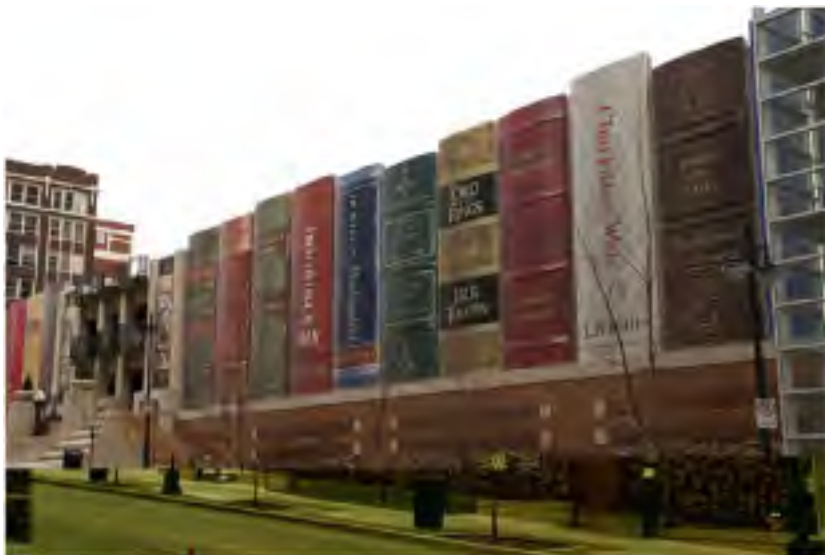
Publika biblioteko en Kansas City, Usono