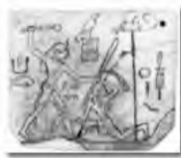
Reĝo (Faraono) Den batas malamikon Bildo sur eburo, el Abydos, ĉ. 3000AKE

Ĉu la ĉisupra bildo sur eburo havas legeblan signifon, aŭ nur ilustras agon de la reĝo? Pri tio ne eblas precize scii nuntempe.