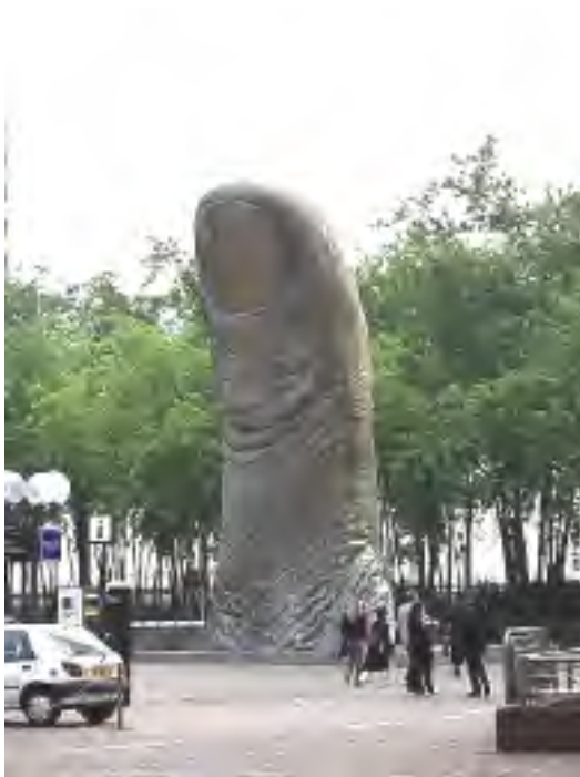
“Polekso” (Parizo), skulptis 1965 César Baldaccini. Altas 12 metrojn.