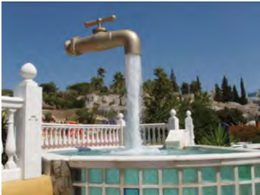
“Magia krano” (Cadiz) [Estas akvotubo kaŝita en la akvofluo.]