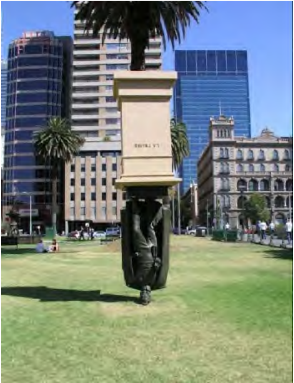
“Charles La Trobe staras sur sia kapo”. Skulptis Charles Robb (2004, Melburno; nun posedajo de Universitato La Trobe, Melburno, Aŭstralio)