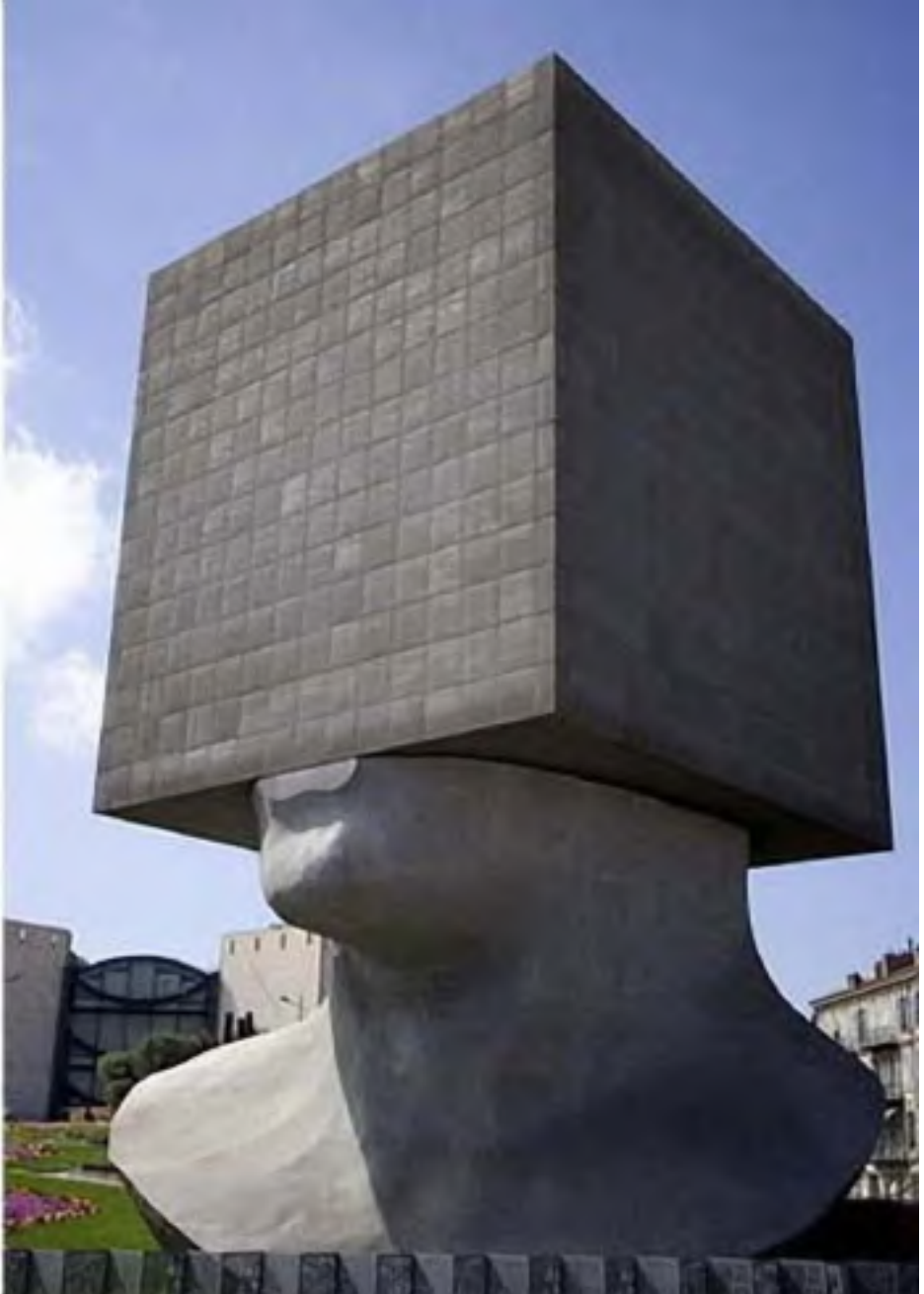
“Kapo Meditanta”, en Nice, Francio