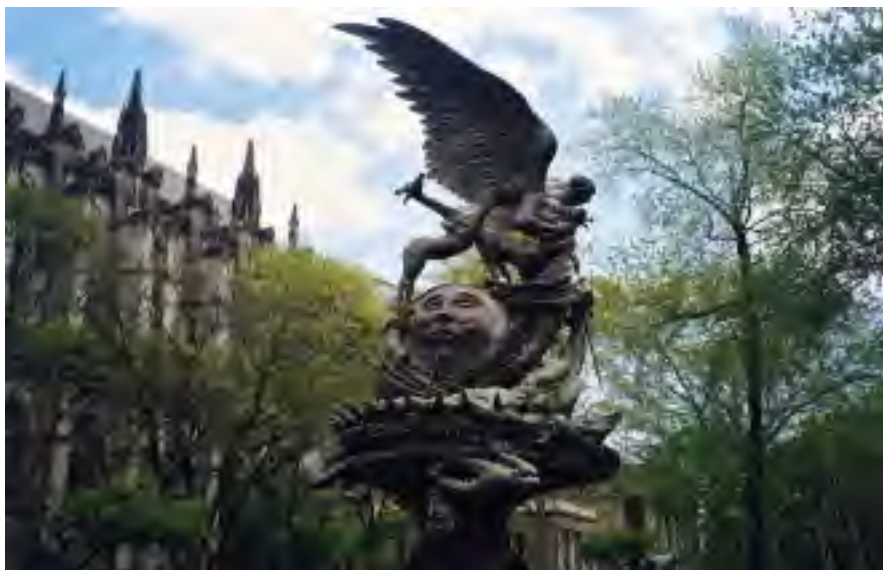
“Pac-Fontano” ĉe Katedralo de Sta Johano la Dia, en la urbo Nov-Jorko. Skulptis Greg Wyatt, 1985