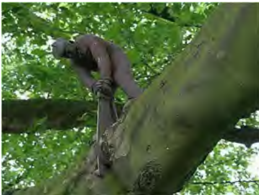
“La segisto” (1989. Amsterdamo)