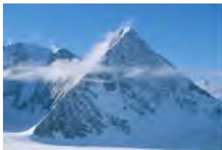
La antarkta “piramido”

de fama Nikola Tesla, diagnozis subterajn kavojn en Visoko. Saša Nađfeji akcentas ke la montego Rtanj estas triflanka asimmetria piramido. La plej longa flanko de la piramido etendiĝas norden. Ĝi estas 3 kilometrojn longa, la sudokcidenta flanko estas 1,5 kilometrojn longa, dum la sudorienta flanko estas 0,75 km. Estas rimarkinde ke la reprezentita rilato estas 4:2:1 — la sama rilato troviĝas en la diferenco de la supermara alteco de la komencaj flankoj kaj la finaj. Rtanj ne nur havas oblikvaĵon saman kiel tiu de La Piramido de la Luno en Meksiko sed ankaŭ la samajn angulojn kiel la piramido de Keopso en Egipto. Esploristo Saša Nađfeji certigas ke oni konstruis nur tri triflankajn piramidojn sur Tero. Unu el ili estas Rtanj, la dua troviĝas en Antarktiko, kaj la