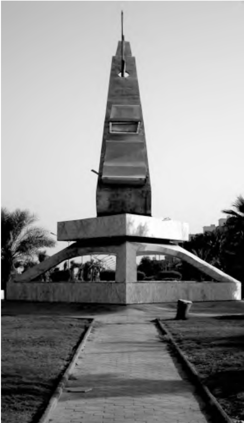
Skulptajo "Rumaihiya" en Kuvajto